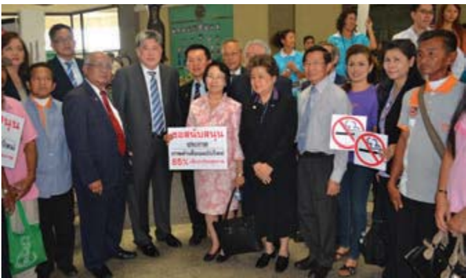
● เครือข่ายนักรณรงค์ มอบดอกไม้เพื่อให้กำลังใจรัฐมนตรีกระทรวงสาธารณสุข ในการออกประกาศภาพคำเตือนฉบับใหม่ ปี 2556

วันที่ 3 - 4 กุมภาพันธ์ 2556 นักรณรงค์จากประเทศมาเลเซีย มาดูงานตลาดนัดจตุจักรปลอดบุหรี่ และการจัดสภาพแวดล้อมปลอดบุหรี่ของบริษัท โอสดสภา ● วันที่ 6 กุมภาพันธ์ มูลนิธิณรงค์ฯ จัดการประชุมเรื่อง “การรณรงค์และประชาสัมพันธ์การจัดเขตปลอดบุหรี่ บทเรียนจากประเทศอังกฤษ ณ โรงแรมมิโด ถ.ประดิพัทธ์ กรุงเทพฯ ● วันที่ 20 กุมภาพันธ์ 2556 มูลนิธิณรงค์ฯ จัดแถลงข่าวผลการสำรวจสถานการณ์การปฏิบัติตามกฎหมายคุ้มครองสุขภาพของผู้ไม่สูบบุหรี่ พ.ศ.2535 ในผู้ประกอบการร้านอินเทอร์เน็ตและเกมส์ ณ ห้องประกายเพชร โรงแรมเอเชีย กรุงเทพฯ ● มูลนิธิณรงค์ฯ ร่วมกับเครือข่ายวิชาชีพสุขภาพ โรงเรียน จัดกิจกรรมให้กำลังใจรัฐมนตรีว่าการกระทรวงสาธารณสุข เพื่อออกประกาศเรื่องภาพคำเตือนบนซองบุหรี่ฉบับใหม่ พ.ศ. 2556 วันที่ 20 กุมภาพันธ์ เวลา 14.00 - 15.00 น. ณ ตึกสำนักงานปลัด กระทรวงสาธารณสุข จ.นนทบุรี ● สำนักงานป้องกันควบคุมโรคที่ 8 กำหนดจัดสัมมนาสุขภาพเขต 18 ประจำปี 2556 หัวข้อ “รู้ก่อน รู้ทัน ป้องกันได้” มูลนิธิณรงค์ฯ เพื่อการไม่สูบบุหรี่ ร่วมจัดนิทรรศการให้ความรู้ ระหว่างวันที่ 5 - 6 มีนาคม ณ โรงแรมแกรนด์ ฮิลล์ รีสอร์ท แอนด์สปา อ.เมือง จ.นครสวรรค์ ● วันที่ 3 - 4 มีนาคม 2556 มูลนิธิณรงค์ฯ พาสื่อมวลชนสัญจร เพื่อร่วมกิจกรรมรณรงค์ชาวพิษณุโลกร่วมใจไม่ขาย ไม่สูบบุหรี่ ไม่ดื่มสุรา ทุกวันพระ ณ หน้าวิหารวัดพระศรีรัตนมหาธาตุวรมหาวิหาร (วัดใหญ่) อ.เมือง จ.พิษณุโลก ● วันที่ 6 มีนาคม 2556 อบรมเชิงปฏิบัติการช่วยคนให้เลิกบุหรี่ และวันที่ 7 - 8 มีนาคม การอบรมพัฒนาศักยภาพเครือข่ายครูเพื่อโรงเรียนปลอดบุหรี่ ณ โรงแรมโดมอนด์ พลาซ่า จ.สุราษฎร์ธานี