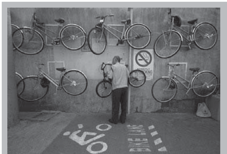
ตัวอย่างที่ดี ร้านขายจักรยาน “ปลอดบุหรี่”

คุณจิตรเขียนต้นฉบับด้วยลายมือ ท่านไม่รู้ด้วยว่าวันหนึ่งมนุษย์ไม่ต้องใช้มือเขียนหนังสือ