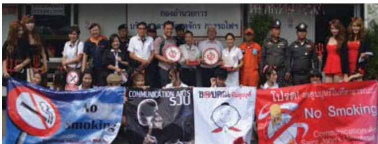
● นักรณรงค์เพื่อการไม่สูบบุหรี่จากประเทศมาเลเซีย เดินทางมาเพื่อดูงานการทำตลาดนัดปลอดบุหรี่ ที่ตลาดนัดจตุจักร และเยี่ยมชมบริษัทโอสดสภา ในการจัดสภาพแวดล้อมปลอดบุหรี่ เพื่อเป็นแนวทางการดำเนินงานที่ประเทศมาเลเซีย