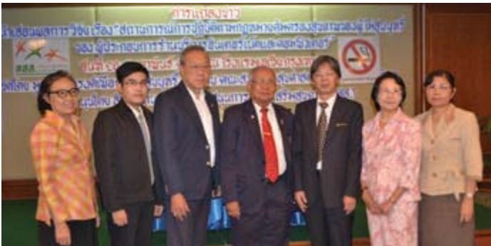
● มูลนิธิรณรงค์ฯ ร่วมกับ คณะสาธารณสุข มหาวิทยาลัยมหิดล ในการจัดแถลงข่าว “ผลการสำรวจสถานการณ์การปฏิบัติตามกฎหมายคุ้มครองสุขภาพของผู้ไม่สูบบุหรี่ พ.ศ.2535 ในผู้ประกอบการร้านอินเทอร์เน็ตและเกมส์”