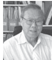
ศ.นพ.ประกิต วาทีสาธกกิจ