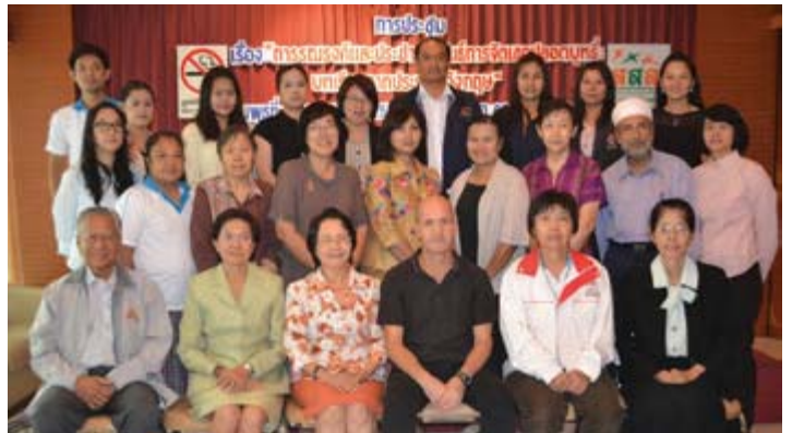
● มูลนิธิรณรงค์ฯ จัดประชุมเรื่อง “การรณรงค์และประชาสัมพันธ์การจัดเขตปลอดบุหรี่ บทเรียนจากประเทศอังกฤษ” ณ โรงแรมมิโด กทม.